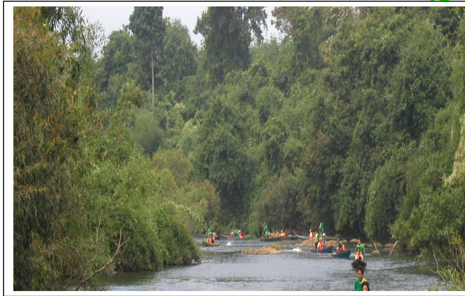
ภาพ 20 สภาพคลองห้วยแครง

1) กำหนดเส้นทางการท่องเที่ยวคลองห้วยแครง ผลที่ได้คือได้เส้นทางการท่องเที่ยวคลองห้วยแครงโดยการเล่นเรือในลำคลองและล่องแก่ง ระยะทางยาว 7 กิโลเมตร (ภาพ 20)