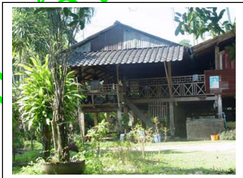
ภาพ 22 โฮมสเตย์ท่ามกลางธรรมชาติ