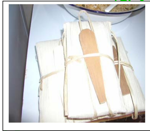
ภาพ 25 ข้าวห่อกาบหมาก

ด้านศักยภาพในการบริการองค์กร ประกอบด้วย การคัดเลือกสมาชิกเป็นคณะกรรมการ รับผิดชอบโดยเป็นการทำงานในสภามหาวิทยาลัยได้คณะกรรมการดังต่อไปนี้คือ