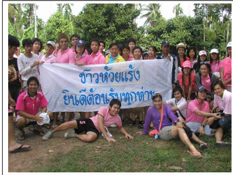
ภาพ 28 การมาเยือนของกลุ่มผู้ทำหน้าที่เป็นกลุ่มทดลองจากนิสิตจุฬาลงกรณ์มหาวิทยาลัย ผลของการเปิดเวทีประชาคม