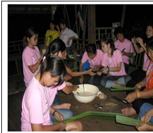
ภาพ 24 การเรียนรู้ขนมจาก

ด้านศักยภาพในด้านภูมิปัญญาพื้นบ้านและการจัดการ ประกอบด้วยโครงการพัฒนาภูมิปัญญาพื้นบ้าน ผู้รับผิดชอบโครงการคือประธานกลุ่มอาหาร (ชุมชนได้เสนอกลุ่มอาหารขึ้นในการประชุม ซึ่งได้รับการรับรอง) กิจกรรมประกอบไปด้วยการทำขนมจาก (ภาพ 24) ทำข้าวห่อกาบหมาก (ภาพ 25) และมีกิจกรรมเสริมคือการตกกุ้งหลวง (เป็นเรื่องเกี่ยวกับการประกอบอาหาร)