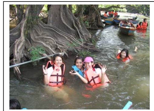
ภาพ 23 การบริหารความเสี่ยงเสื้อชูชีพ