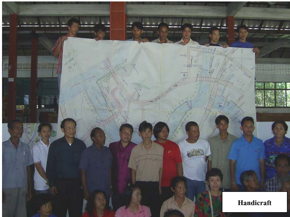
ภาพ 19 แผนที่ภาพบริบทชุมชน

จากนั้นจัดอันดับที่พึงปรารถนาว่าจะเลือกที่จะศึกษาเส้นทางทางท่องเที่ยวที่เป็น ลำคลองโดยการแสดงนิทรรศการยกมือในที่ประชุม ซึ่งผลของการประชุมได้ภาพที่สะท้อน ศักยภาพของพื้นที่ทั้งตำบล ซึ่งถือว่าเป็นฐานข้อมูลในการตัดสินใจ และตกลงกันว่าให้มีการสำรวจ เส้นทางทางท่องเที่ยวตามลำคลอง จะเห็นได้ว่าจุดสนใจของชุมชนในขณะนี้อยู่ที่คลองห้วยแร้ง โดยเฉพาะ