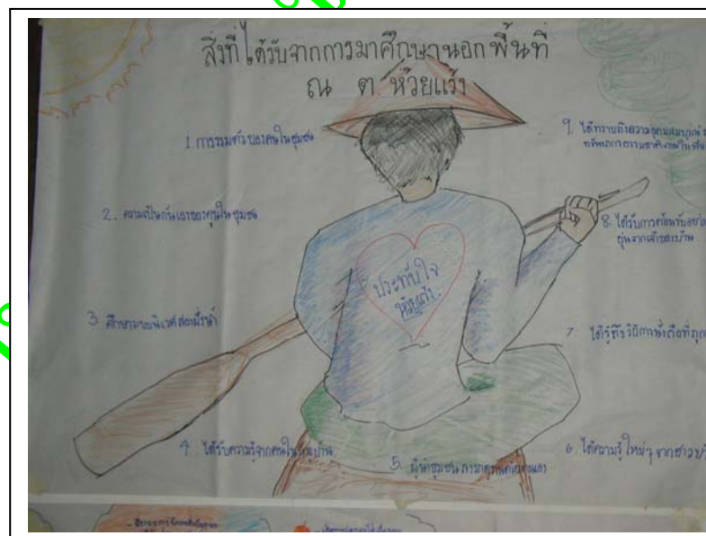
ภาพ 27 การประเมินของผู้มาเยือนจากการแลกเปลี่ยนเรียนรู้ร่วมกันกับผู้ต้อนรับ