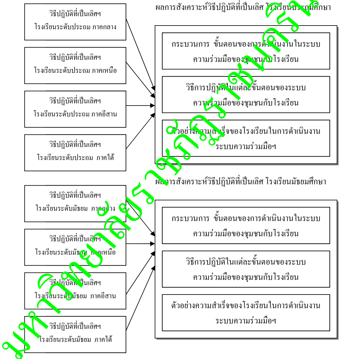
ภาพ 3 กรอบแนวคิดการวิจัยระยะที่ 3

ระยะที่ 3 ขั้นการศึกษา สังเคราะห์วิธีปฏิบัติที่เป็นเลิศ (Best Practices) ระบบความร่วมมือ ของชุมชนกับโรงเรียน ในโรงเรียนระดับประถมศึกษา และมัธยมศึกษา ตามแนวทางการสังเคราะห์วิธีปฏิบัติที่เป็นเลิศ สถาบันวิจัยและพัฒนาการเรียนรู้