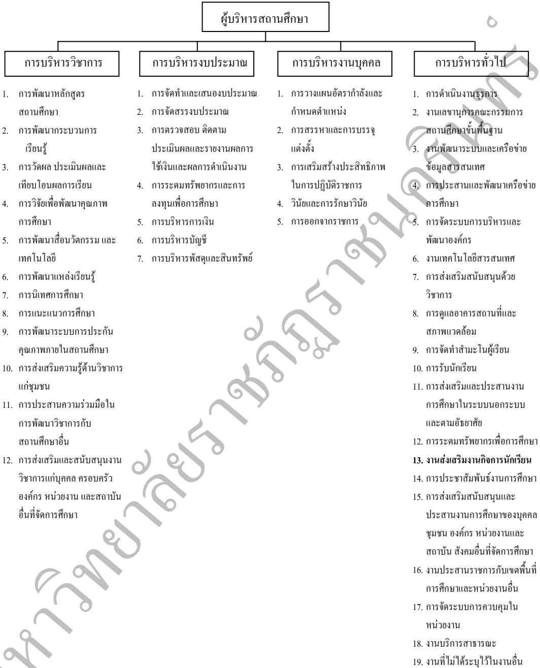
ภาพ 4 ขอบข่ายการจัดการศึกษาในสถานศึกษา