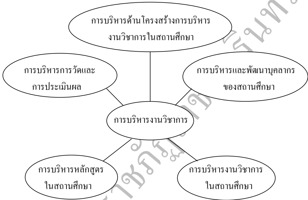
ภาพ 9 แนวทางการบริหารงานวิชาการ

และจากการบริหารงานวิชาการทั้งหมดอาจสรุปเป็นภาพ ได้ดังนี้